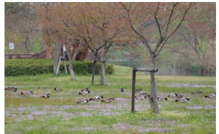
ヒドリガモ 新川ほとり 4/17