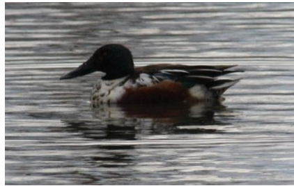
ハシビロガモ 大川河口 12/1