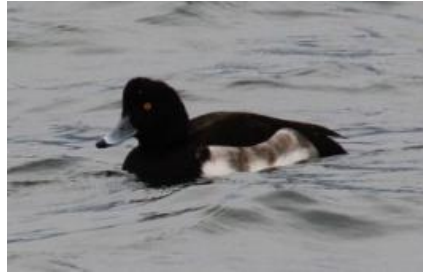
キンクロハジロ なぎさ公園 12/5

オスは首から頭は緑色、くちばしが黄色く、首に白い輪がある。メスはからだ全体が褐色