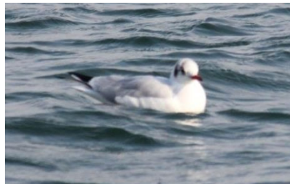
クリカモメ なぎさ公園 1/9