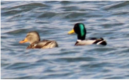
マガモ なぎさ公園 12/13

冬から春先にかけて、大川やみさき自然公園・なぎさ公園など、みさき一帯にやってくる鳥たちです。 美崎公園パークセンター 077(585)4280