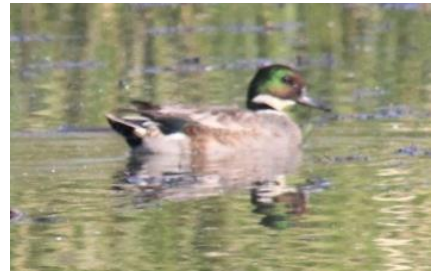
ヨシガモ 大川河口 11/1

オスの頭は赤紫色と光沢のある緑色。後方の羽が藁のように長くとれ、別名「みのガモ」