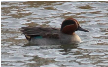
コガモ 新川河口 12/1

オスの頭は赤紫色と光沢のある緑色。後方の羽が藁のように長くとれ、別名「みのガモ」