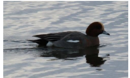
ヒドリガモ なぎさ公園 12/5