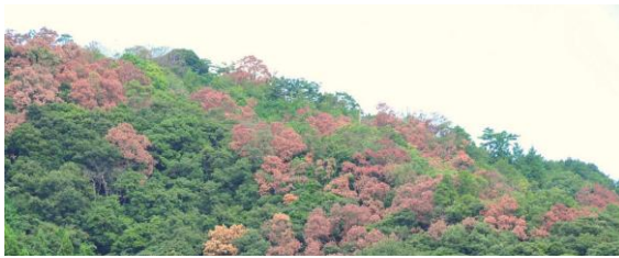
ナラ枯れ（被害にあったミズナラやコナラなどが枯れている） 報告があった市町村

減少傾向にありました。それが今、この美崎公園にやってきたのです。今年2本が被害にあいましたが、来年広がることが心配です。春までに伐採して、燃やすか薄く細かいチップにするなどの対策をします。